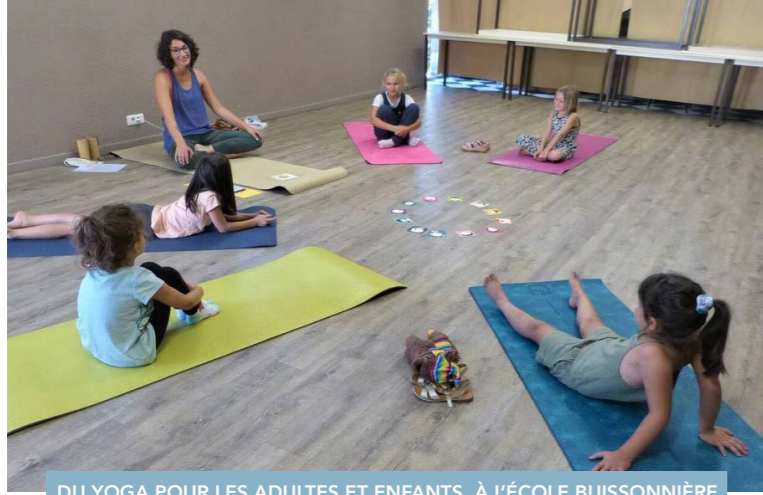
DU YOGA POUR LES ADULTES ET ENFANTS, À L'ÉCOLE BUISSONNIÈRE