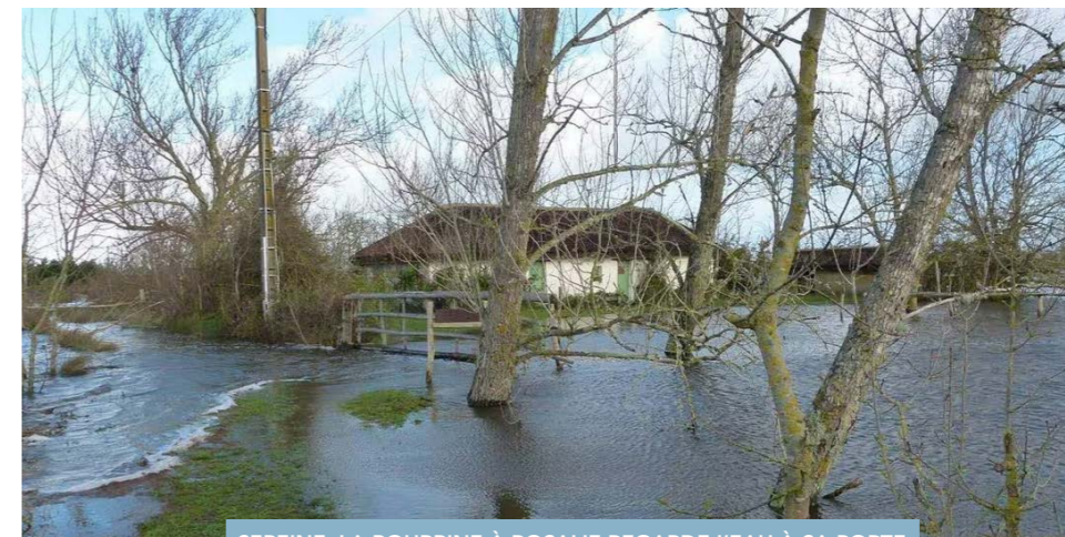
SERINE, LA BOURRINE À ROSALIE REGARDE L'EAU À SA PORTE