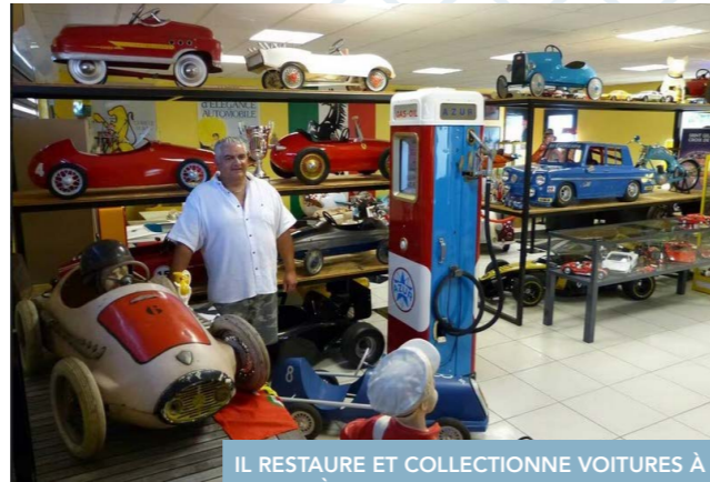
IL RESTAURE ET COLLECTIONNE VOITURES À PÉDALES ET MANÈGES ANCIENS