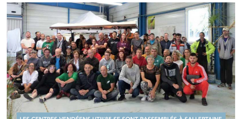
LES CENTRES VENDÉENS UTIL'85 SE SONT RASSEMBLÉS À SALLERTAINNE