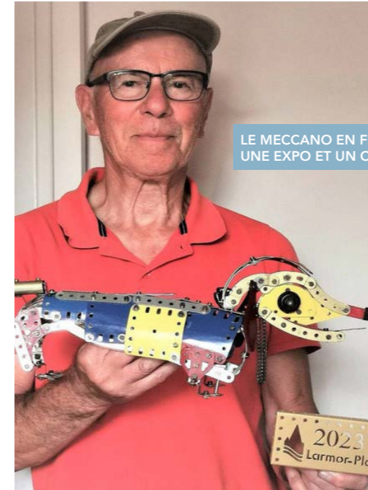
LE MECCANO EN FÊTE AVEC UNE EXPO ET UN CONCURS