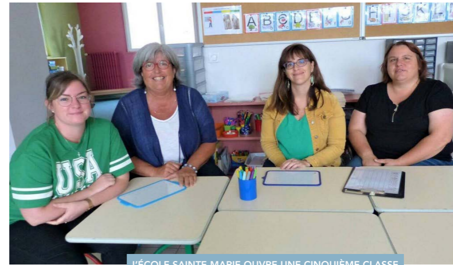
L'ÉCOLE SAINTE-MARIE OUVRE UNE CINQUIÈME CLASSE