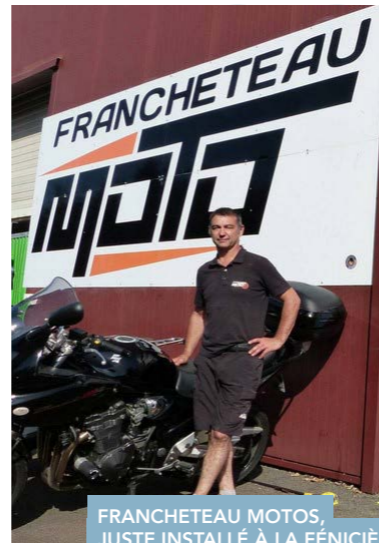
FRANCHETEAU MOTOS, JUSTE INSTALLÉ À LA FÉNICIÈRE