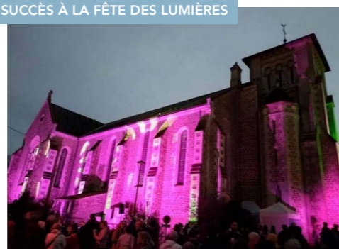
SUCCÈS À LA FÊTE DES LUMIÈRES