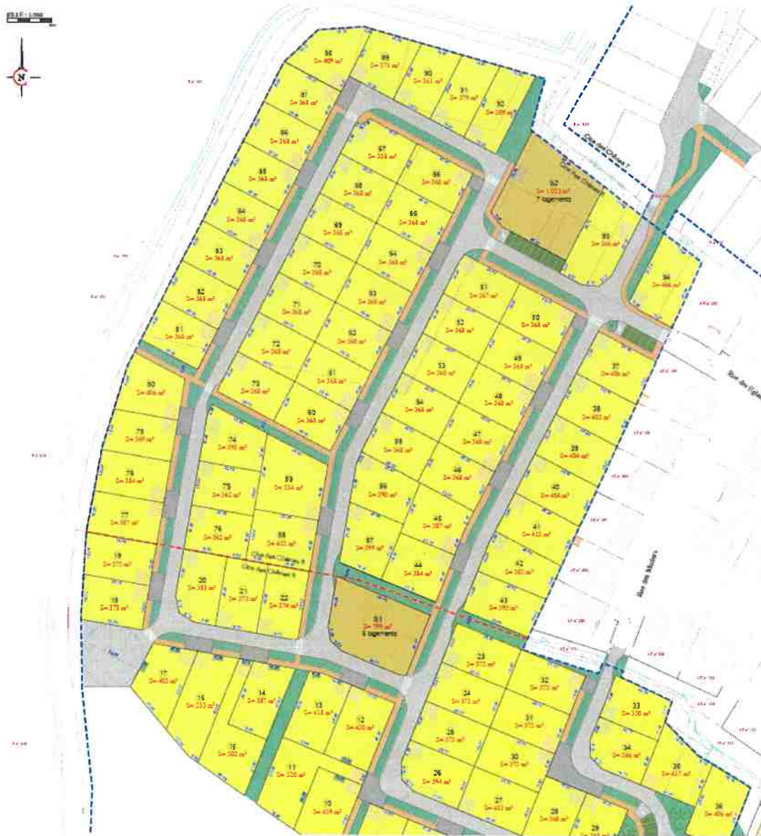
Esquisse Le Clos des Chênes 6 montrant la liaison entre le 6 et 7 :

Monsieur Le Maire présente le projet d'aménagement du lotissement Le Clos des Chênes 6. Cela représente environ 58 lots sur 3,06 hectares dans le prolongement des lotissements le Clos des Chênes 1 à 5.